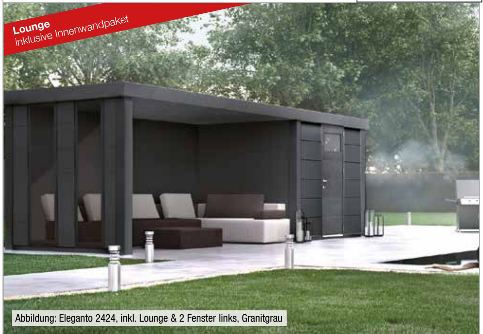
Abbildung: Eleganto 2424, inkl. Lounge & 2 Fenster links, Granitgrau