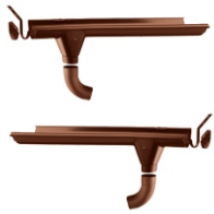
ABLAUF MIT HÄNGENDEM BOGEN