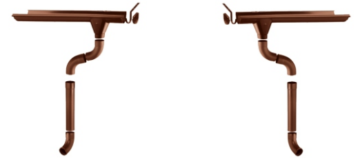
ABLAUF MIT BODENBOGEN